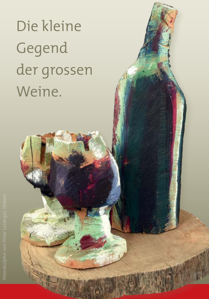
Weinskulptur von Peter Leisinger, Malans